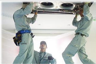
暖房(冷房)の効が悪い