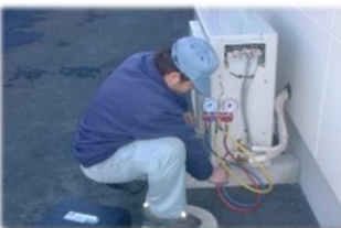
フロン点検の必要がある