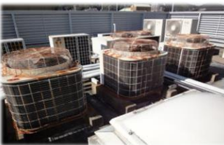
そろそろ新しく入れ替えたい