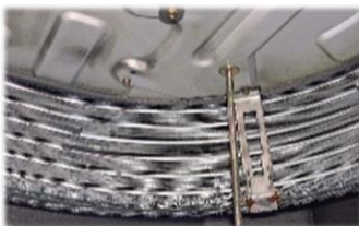
熱交換器を洗浄したい