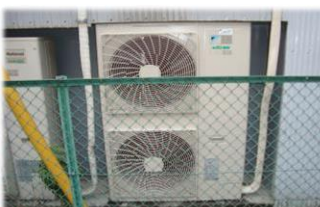
点検しづらい場所にある