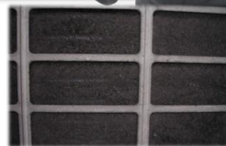
塵やほこりが溜まっている