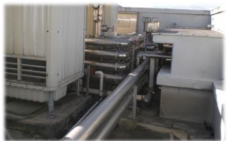
空調機を移設したい