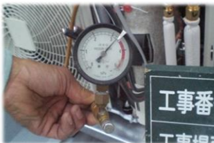
冷媒交換する必要がある