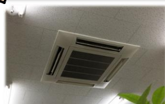
送風から異臭がする