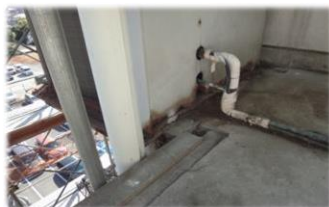
配管がむき出しになっている