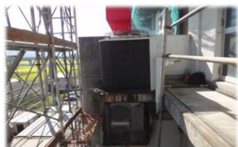
室外機から異音がする